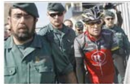
Heavy going: Civil Guards clear a path for Lance Armstrong before the start of the first stage of the Tour of Murcia.

As the Tour of Murcia enters its second day Lance Armstrong has said he is feeling the physical demands of his second year back in cycling.