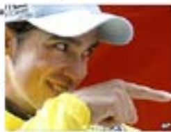
The saga of Contador's drug test failure is far from over

Clenbuterol is a stimulant that increases breathing capacity and boosts the flow of oxygen in the bloodstream.